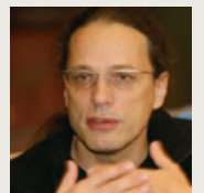
ゲルフリート・ストッカー